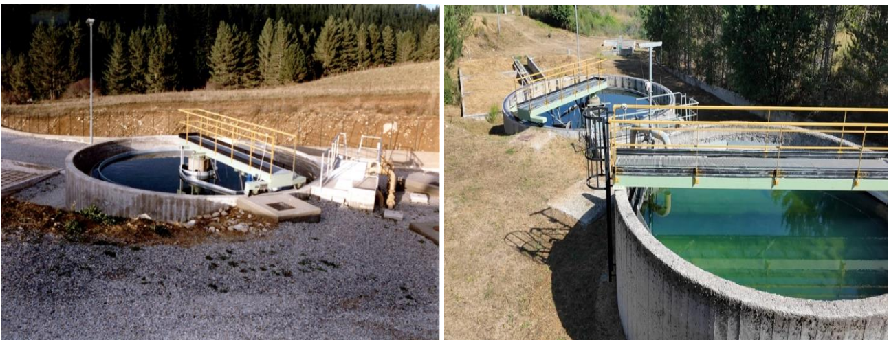
Il depuratore di Lorica prima e dopo i lavori

La località turistica di Trepidò sul Lago Ampollino è sprovvista di un sistema di depurazione efficiente, tant'è che la località è inserita insieme al Comune di Cotronei tra i siti individuati nella infrazione comunitaria della UE all'Italia (2017/2181) per inquinamento ambientale. Nel 2018 il Comune di Cotronei ha ottenuto un finanziamento di 4.458.000 euro finalizzato alla chiusura dell'attuale impianto, obsoleto e fatiscente e sequestrato nel 2019, attraverso il potenziamento dell'impianto di loc. Cona fino a 21.000 a.e. la realizzazione della rete fognaria nelle zone non servite di loc. Trepidò e collettamento dell'intero carico all'impianto di Loc. Cona del Comune di Cotronei (KR). Con questo intervento si intendono superare i problemi di funzionalità dell'attuale depuratore non adeguato ad assorbire il flusso di presenze che durante il periodo estivo si triplicano. La crescita disordinata ed abusiva del villaggio turistico di Trepidò a partire dagli anni '50 sul versante di Cotronei del bacino lacustre, ha creato una situazione insostenibile dal punto di vista ambientale a cui non ha rimediato nemmeno la presenza del Parco nazionale della Sila, il cui confine però coincide con le acque del bacino, e quello che succede oltre il perimetro del Parco è terra di nessuno.